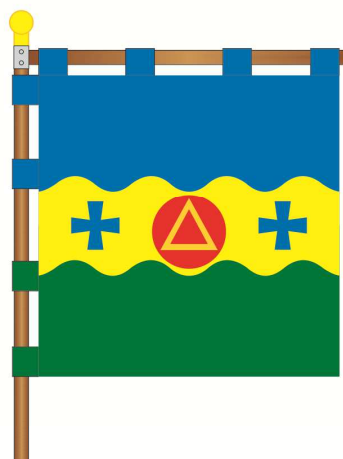
Вертикальне кріплення до древка з додатковим горизонтальним кріпленням