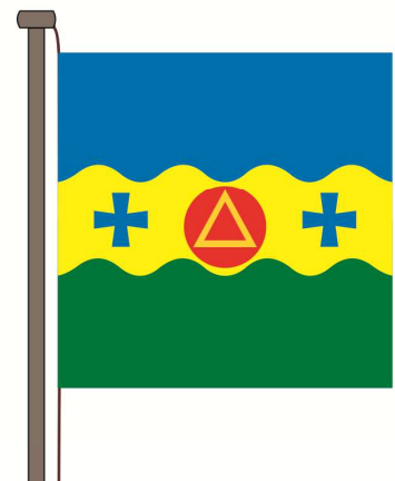
Вертикальне кріплення до фалу на прапорівій щоглі