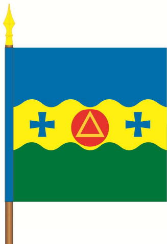
Вертикальне кріплення до древка