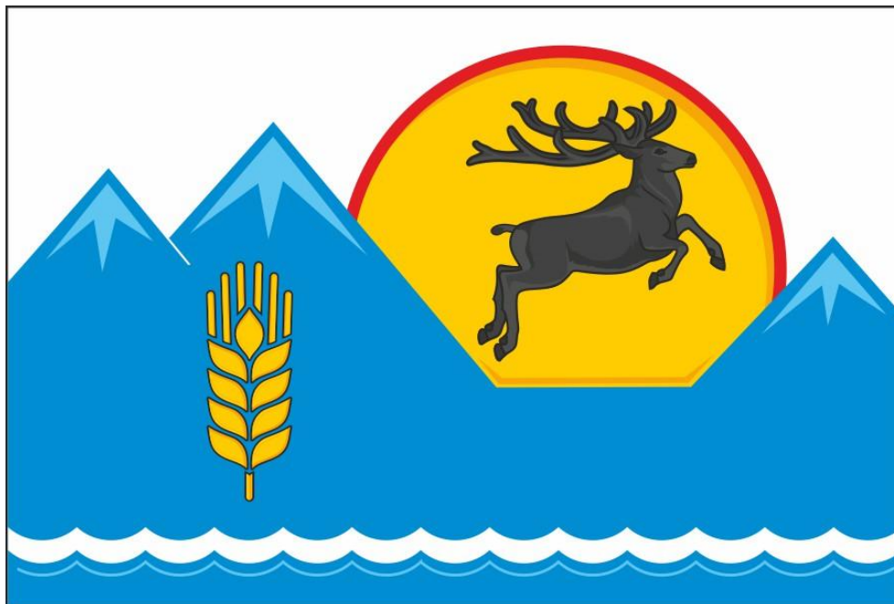
Флаг муниципального образования «Усть-Коксинский район» (цветное изображение)