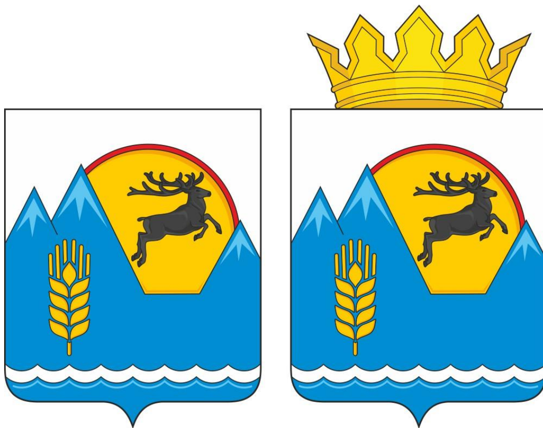
Герб муниципального образования «Усть-Коксинский район» (примеры воспроизведения в цвете)