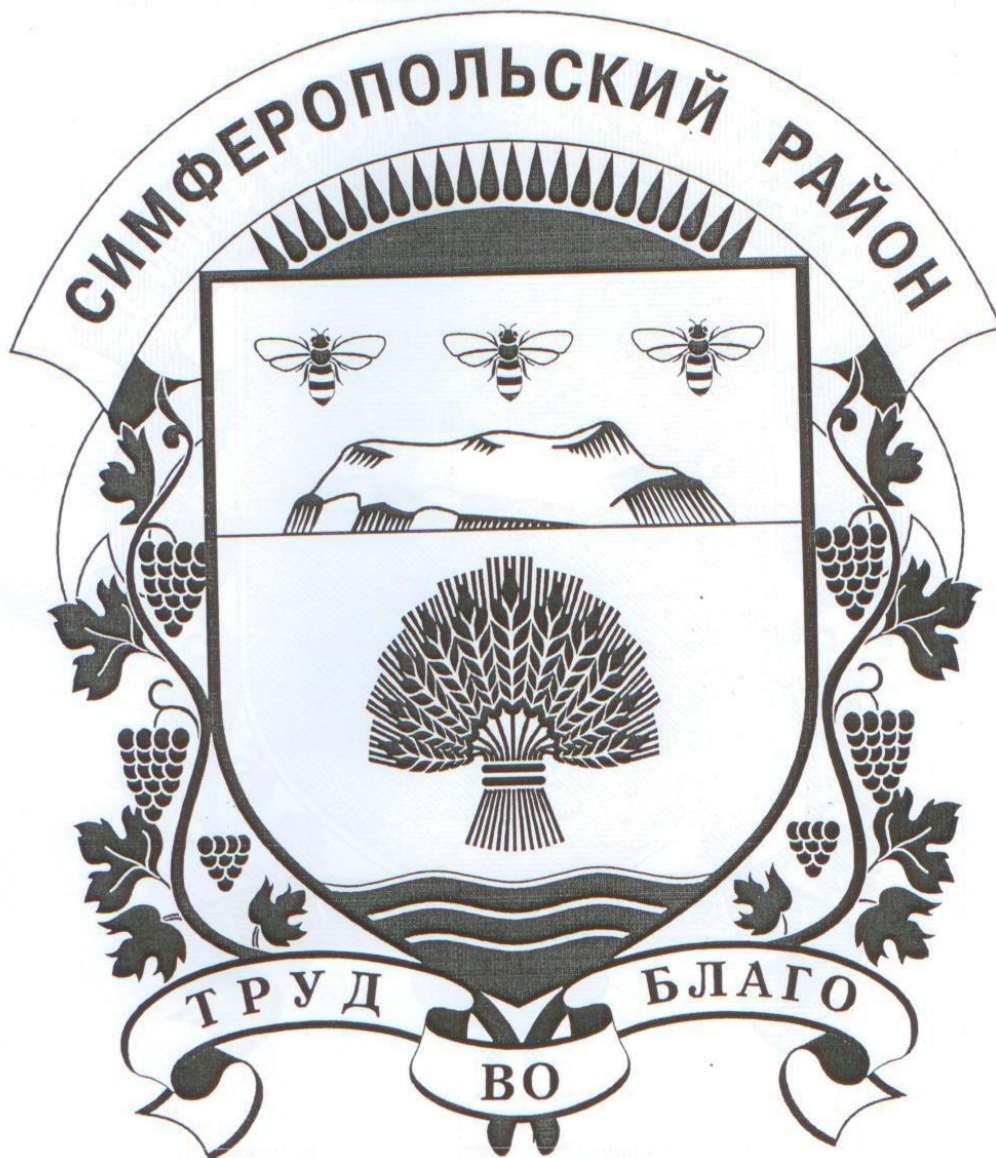
Рисунок герба муниципального образования Симферопольский район Республики Крым в одноцветном варианте

Приложение 3 к решению к решению 20 сессии Симферопольского районного совета Республики Крым I созыва от «04» 08 2015 г. № 324