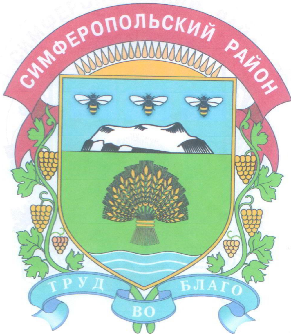
Рисунок герба муниципального образования Симферопольский район Республики Крым в многоцветном варианте

Приложение 2 к решению к решению 20 сессии Симферопольского районного совета Республики Крым I созыва от «04» 08 2015 г. № 324