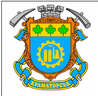
Великий герб територіальної громади м.Краматорська