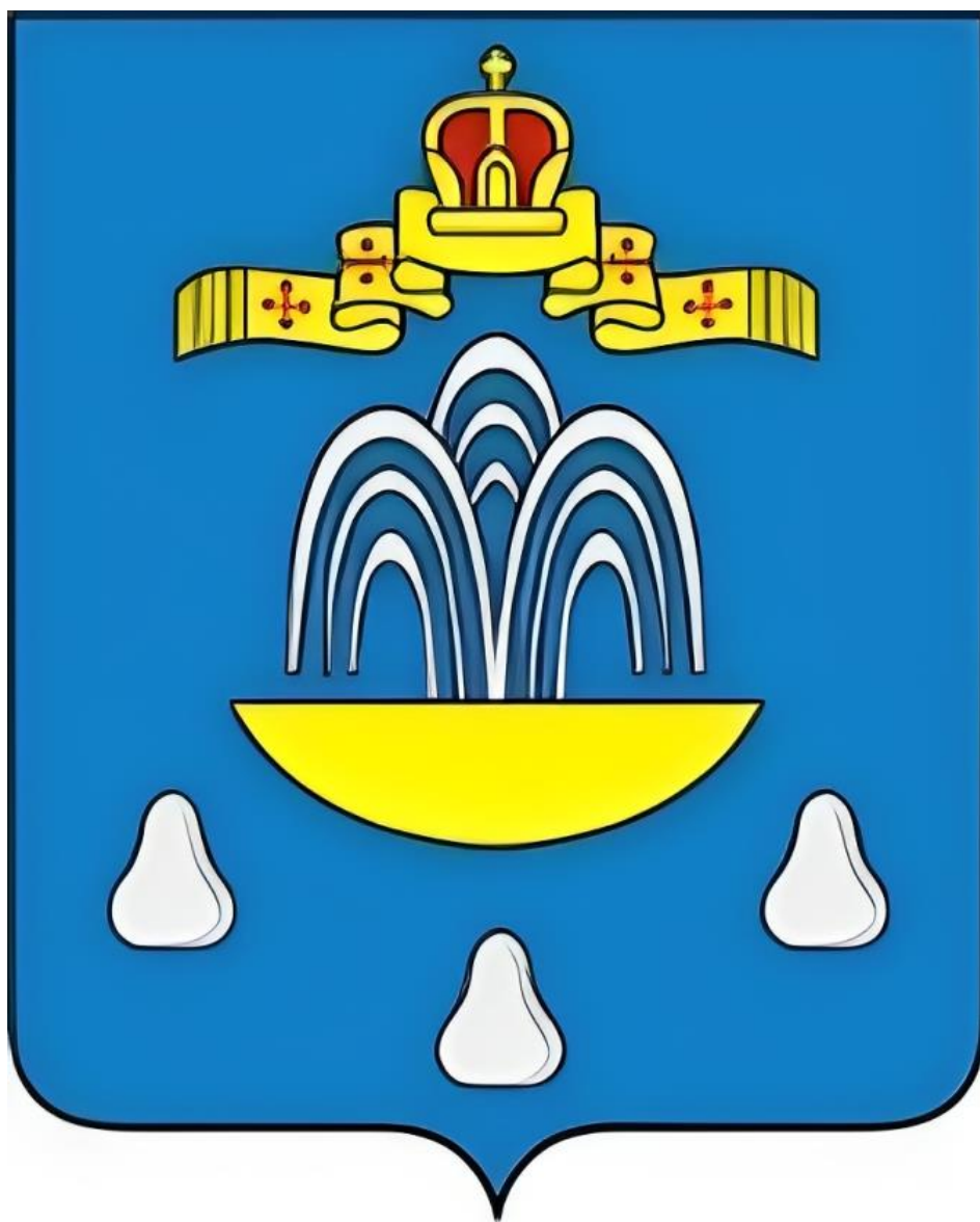
Герб Кашинского городского округа Тверской области (цветное изображение)