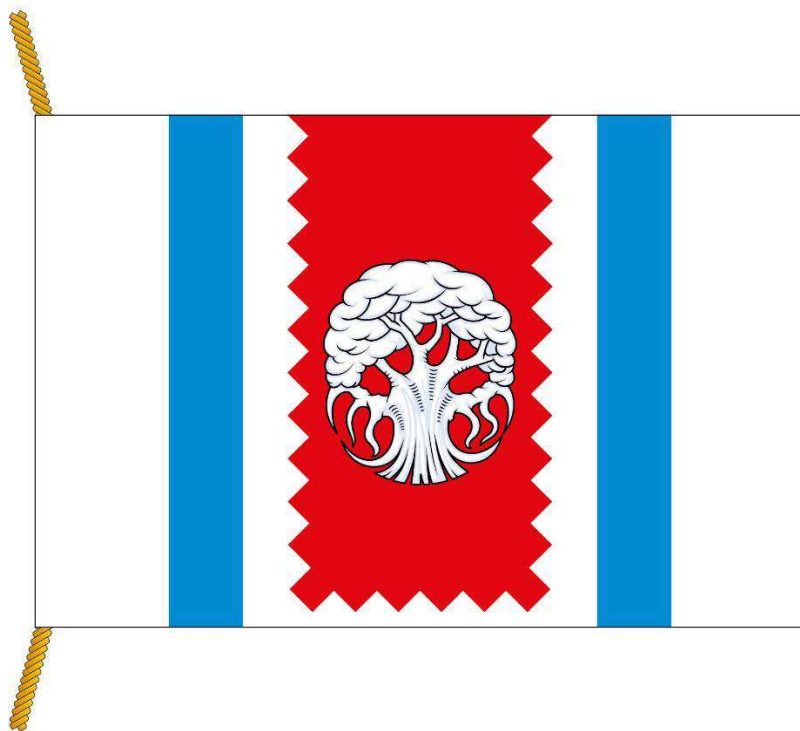
РИСУНОК ФЛАГА МУНИЦИПАЛЬНОГО ОКРУГА ЗАПАДНОЕ ДЕГУНИНО (лицевая сторона)