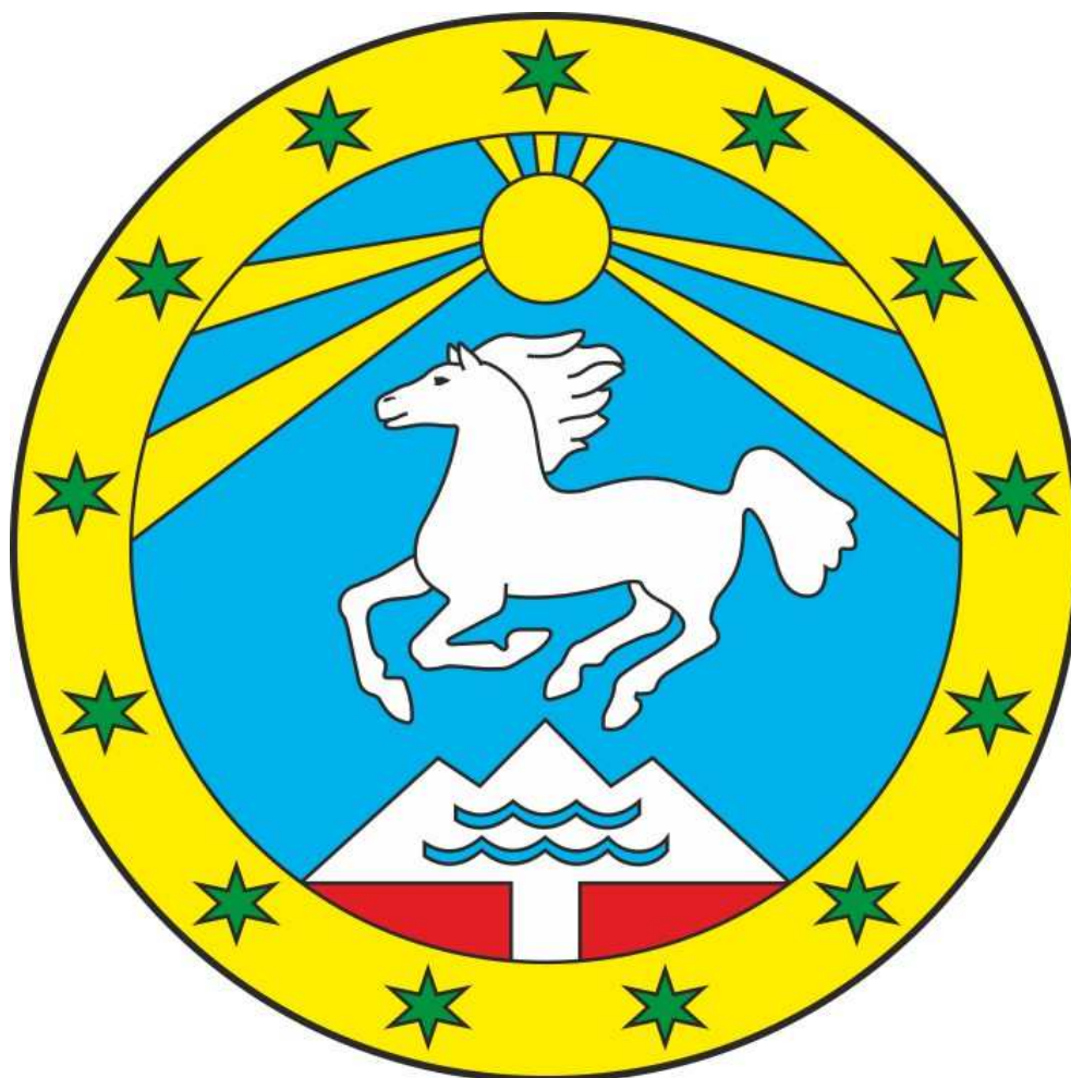
Герб муниципального образования «Улаганский район» (пример воспроизведения в цвете)