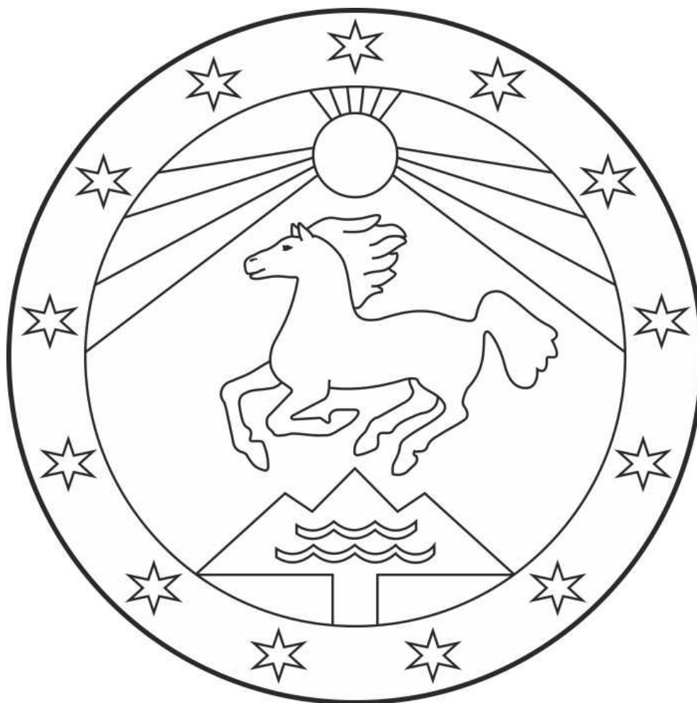
Герб муниципального образования «Улаганский район» (пример контурного воспроизведения в чёрном и белом цветах)