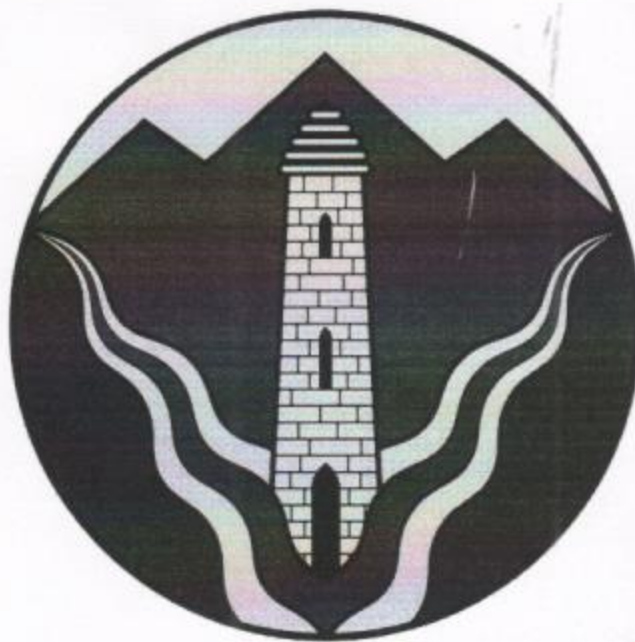
Герб Шатойского муниципального района (примеры воспроизведения в цвете)