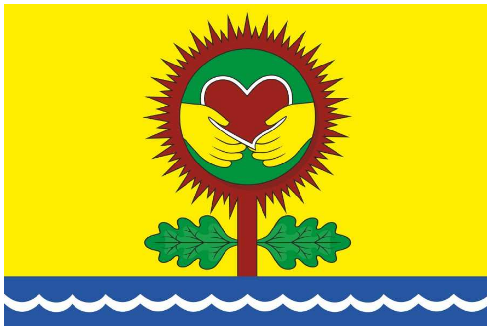
Флаг Магаринского сельского поселения Шумерлинского района Чувашской Республики (цветное изображение)