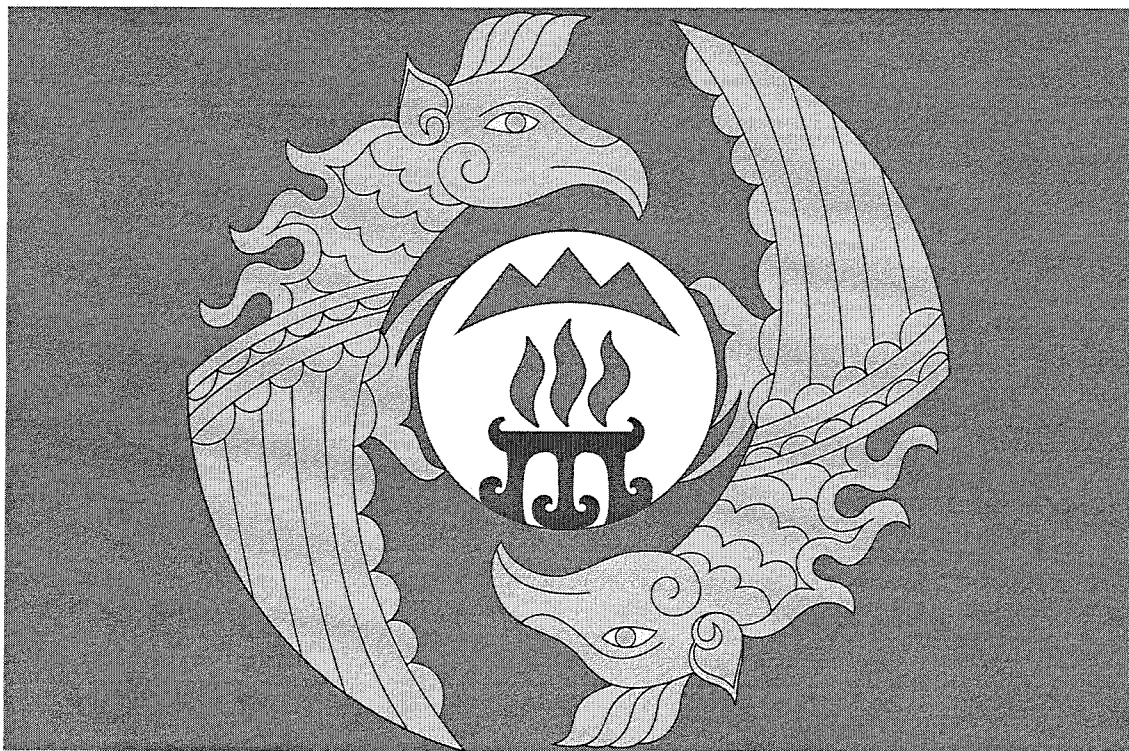
Флаг муниципального образования «Онгудайский район» (цветное изображение)