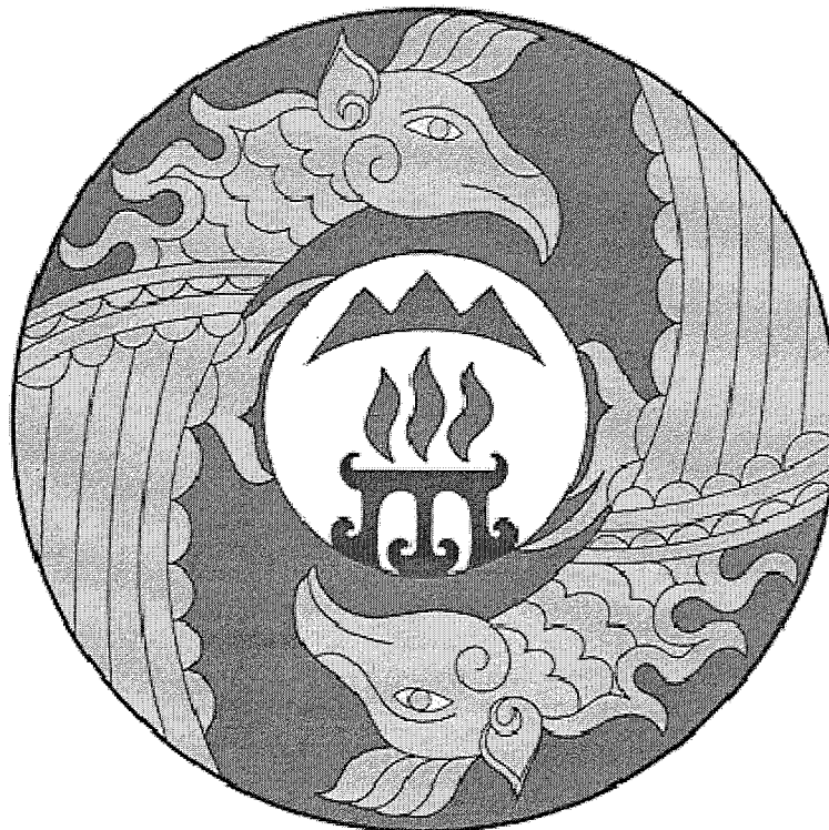
Герб муниципального образования «Онгудайский район» (пример контурного воспроизведения в чёрном и белом цветах)