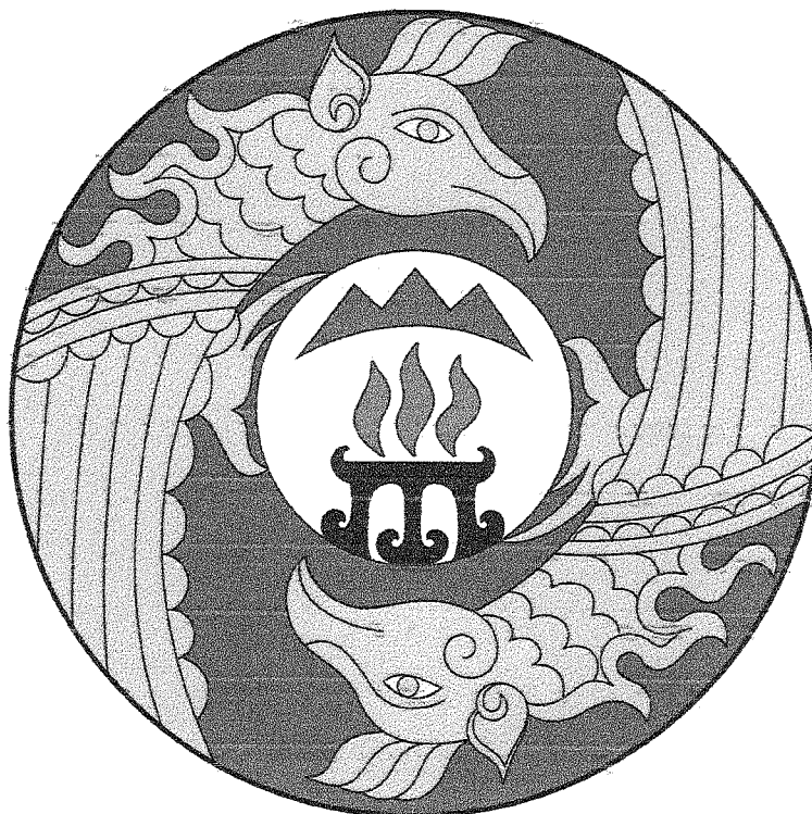
Герб муниципального образования «Онгудайский район» (пример воспроизведения в цвете)