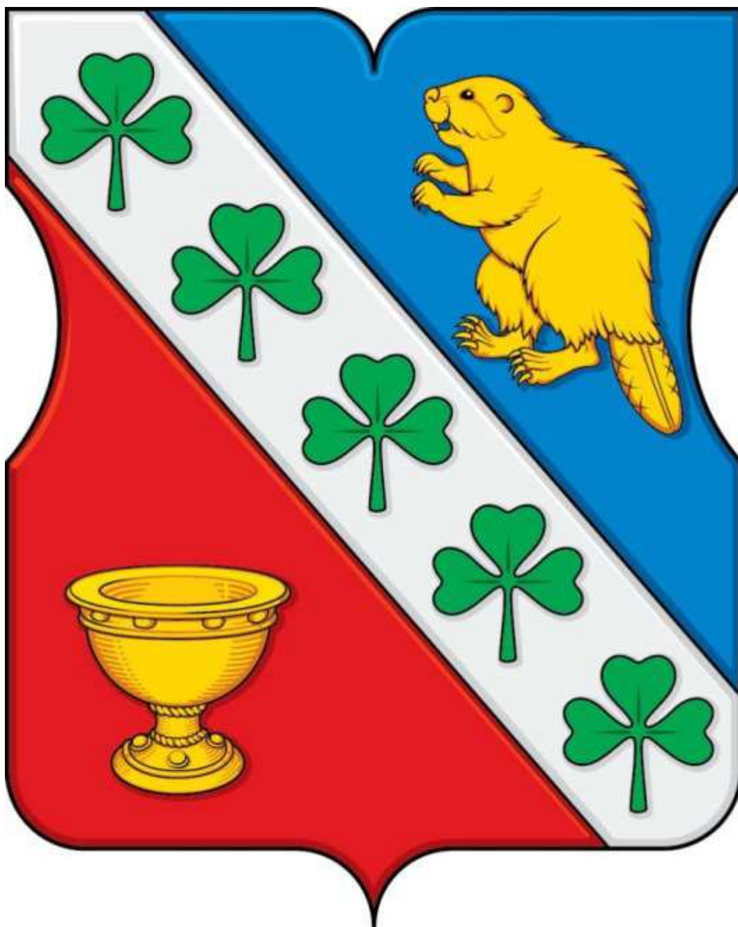
ПРИЛОЖЕНИЕ 2 к Положению «О гербе муниципального округа Бибирино»