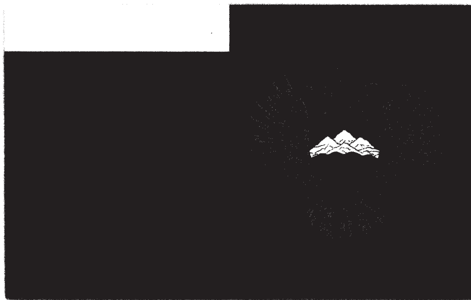
Рисунок флага Министерства Российской Федерации по делам Северного Кавказа

УТВЕРЖДЕН приказом Министерства Российской Федерации по делам Северного Кавказа от « 11 » МАЯ 2016 г. № 65